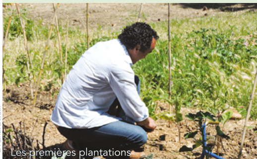
Les premières plantations

Le projet "Jardin partagé de Celleneuve" a démarré : l'association est créée, la mairie a préparé le terrain situé square des Escarcelliers.