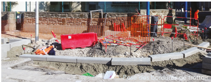
Pose des bordures de trottoir

D n 2010, le comité de quartier de Celle-neuve contactait les services municipaux pour demander la mise à 2 voies de circulation sur l'avenue de Lodève, de l'esplanade Léo Malet au carrefour du centre commercial. Quelques années plus tard, la municipalité présentait un projet intéressant, mais hélas non inscrit au budget !