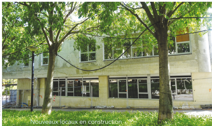
Nouveaux locaux en construction

L es responsabilités de ces 6 classes de CP partagées pour moitié entre les deux écoles de notre quartier seront divisées entre les deux directions. Les nouveaux élèves de CP seront répartis selon divers critères dans l'une ou l'autre école (fratrie, adresse).