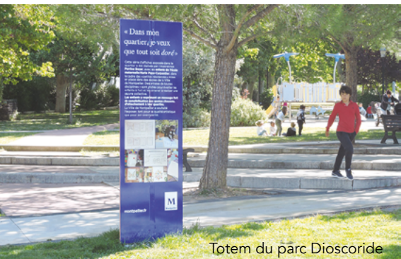
Totem du parc Dioscoride