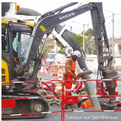
Travaux sur les réseaux

M ais patience... Ces désagréments devraient prendre fin en 2020, après 10 ans d'attente ! L'avenue de Lodève verra alors une circulation régulée et de nombreux aménagements indispensables : parkings, piste cyclable, larges trottoirs ainsi que la plantation d'arbres.