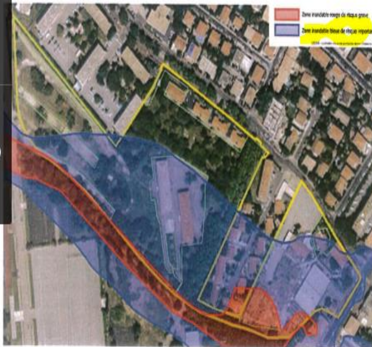
Figure 32 - Localisation des surfaces perméables du secteur « Chasseurs » en état actuel

La figure suivante localise les surfaces perméables (en vert) en état actuel du quartier (délimité en jaune) et le zonage du PPRI (zone bleue et zone rouge, cette dernière étant centrée sur le cours d'eau).